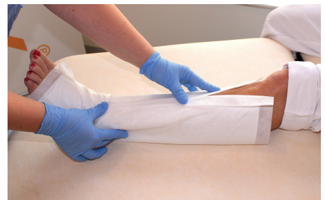
3. Fortsätt att vika upp förbandet runt hela benet.