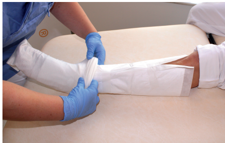
5. Trä en tubgas som en strumpa över förbandet.