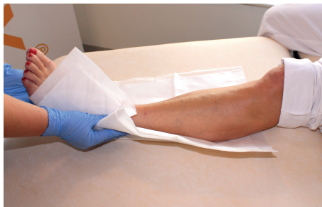
2. Vik in förbandet från båda sidorna vid fotknölen så att foten täcks.