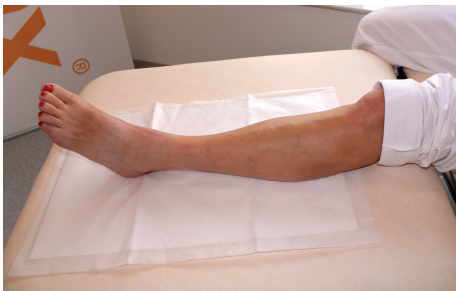
1. Placera förbandet under benet.