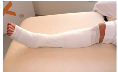
6. Förbandet sitter på plats.