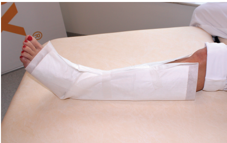
4. Se till att sårområdet är täckt. Använd tejp för att hålla den vikta stövelformen på plats.