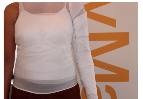
3. Förbandet sitter på plats.